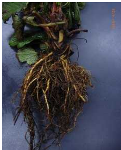
排水不良ほ場で根が黒変した親株 霜によるランナーの焼け

アブラムシの発生は多く、一部ではカキノヒメヨコバイによる心葉の展開不良ほ場が見られており、親株床の排水対策や病害虫防除を遅れないように行う。