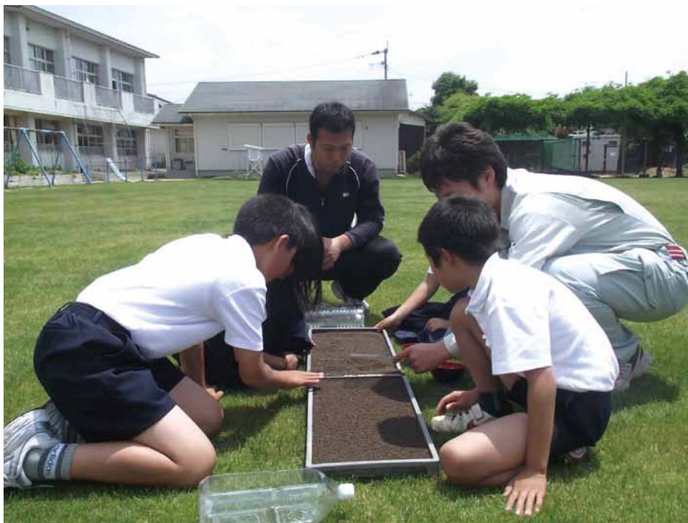
青年部と普及センターの指導のもと播種作業をする大莞小学校の児童