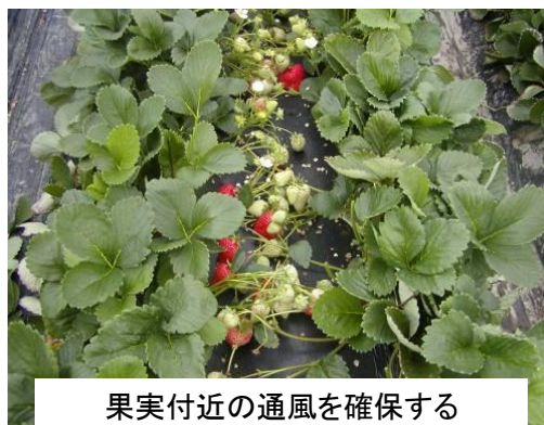
果実付近の通風を確保する

また、果実付近の通風が悪くなっている場合は、果実表面に「かび」の発生が懸念されるため、葉除け等を行い果実付近の通風を確保する。また、果梗の除去も発生防止につながる。