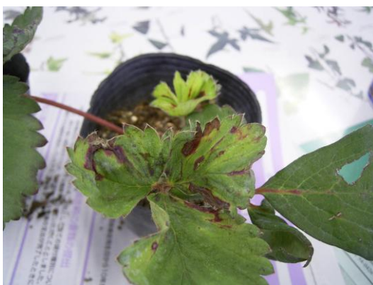
カキノヒメヨコバイの食害あと